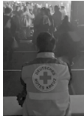
Sanitätsdienst Heimatabend Narrenzunft Jägi 2024

zeitnah unter der Email Adresse: drk.ov.rgd@gmx.de . Wir freuen uns, wenn wir Euch unterstützen dürfen.