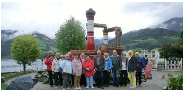
Hundertwasser-Brunnen in Zell am See

Ein großes Dankeschön gab es für Busfahrer Herbert Noll für die gute und sichere Fahrt sowie für Regina Noll für Ihre Arbeit während der schönen Reise.