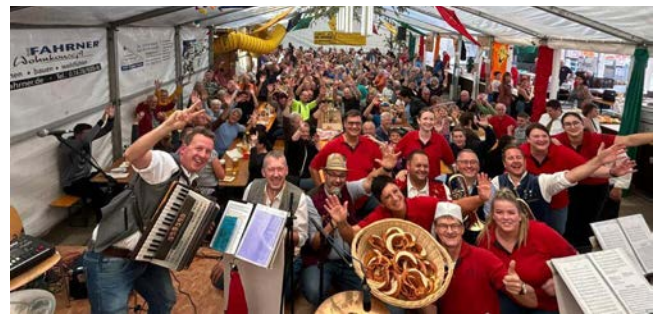
Eure Musikkapelle Höfendorf

Ab 14.30 Uhr lockte die Plettenbergstammtischmuseg mit ihrem Programm die letzten Musikermuffel aus ihren Reserven. Wir danken allen Helfern, Kuchenbäcker und Sponsoren sowie unseren Besuchern unseres Festes und freuen uns jetzt schon auf eine Fortsetzung im Jahr 2025.