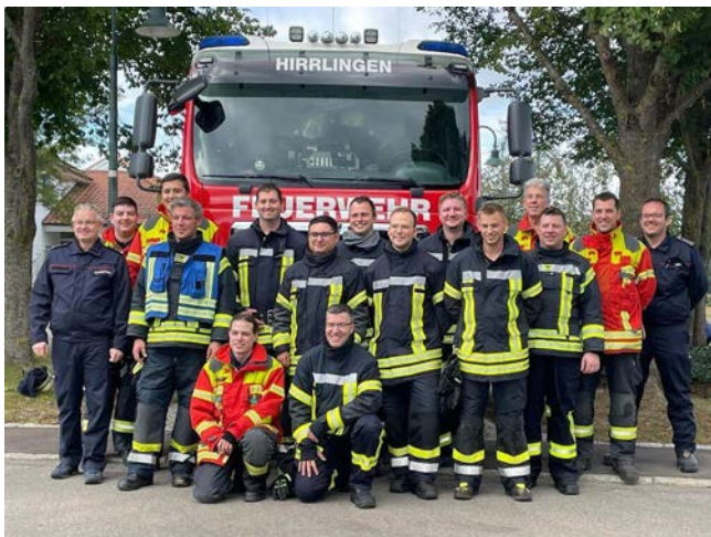
Die zwei Gruppen aus Hirrlingen und Rangendingen, Keistungsstufe Gold