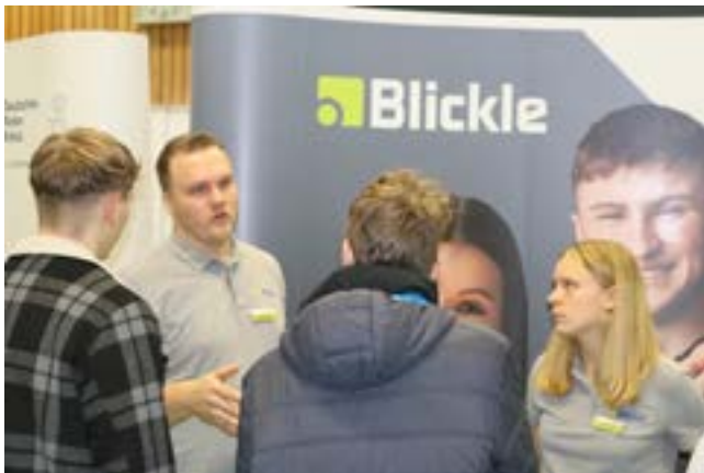
Viele gute Gespräche gab es auf der Berufsinformationsmesse des BSZ