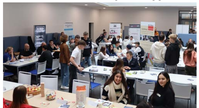
Berufe-Speed-Dating im BSZ